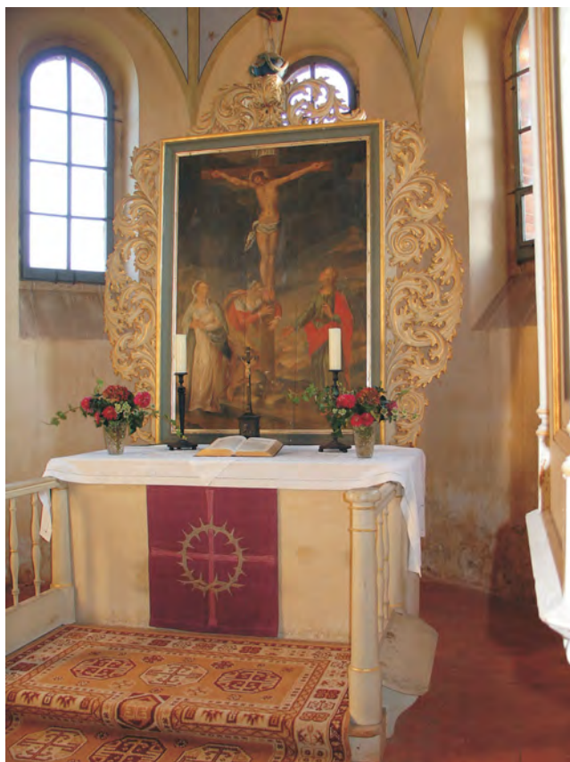
Altar der Dorfkirche Borstel

JESUS CHRISTUS SPRICHT: WACHET! Mk 13,37